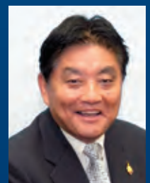
河村 たかし 名古屋市長

主催：愛知・名古屋産業立地プロモーション事業実行委員会(構成：愛知県、名古屋市)